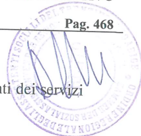
figure permette un migliore servizio. Il gruppo di lavoro è costituito da rappresentanti dei servizi sociali, sanitari, ordine degli avvocati, rappresentanti del tribunale.

La riunione si chiude alle ore 20.00 circa